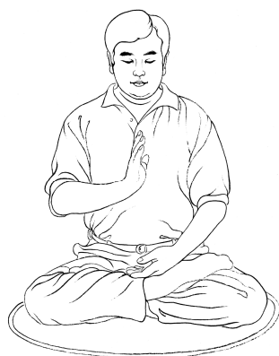
عمود نگه‌داشتن یک دست